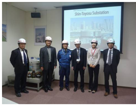
東京電力新豊洲変電所訪問