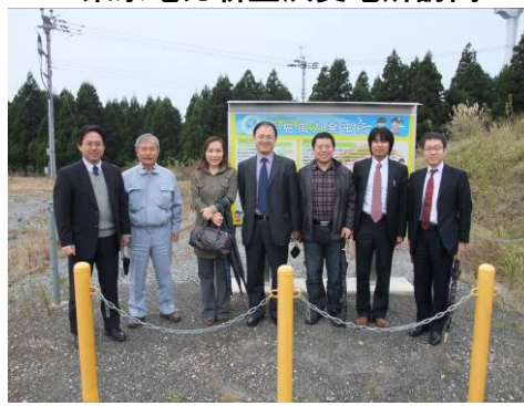
長島風力発電所訪問