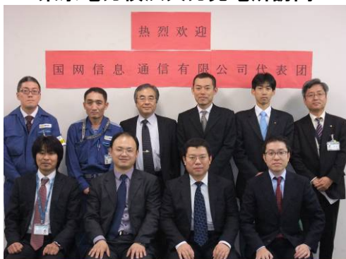
関西電力三国営業所訪問