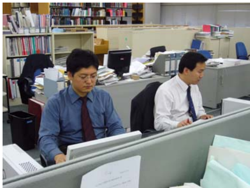
当調査会での業務風景