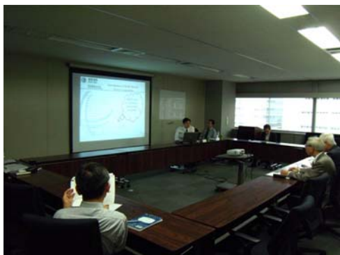
当調査会での発表風景