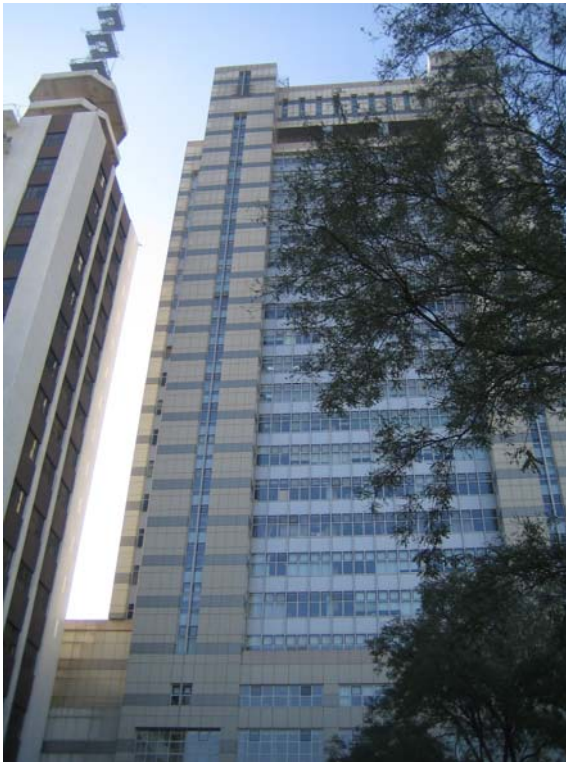
国網信息通信有限公司ビル