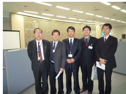
中央給電指令所訪問