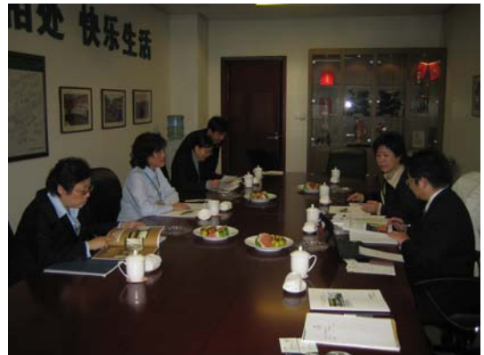
浙江省電力公司訪問