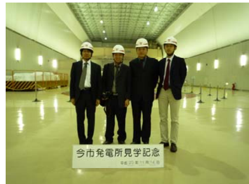
今市場水発電所訪問